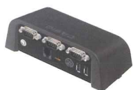
Boîte d'extension (uniquement V-R7000)