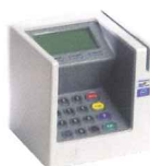
Terminal de paiement